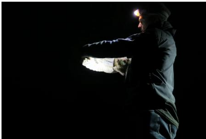
Sarvipöllön siiven kuviointi ja väri auttaa määrittämään linnun iän ja sukupuolen.

Hangon lintuasema sijaitsee Uddakatanin luonnonsuojelualueella, jossa liikkuminen on sallittu ainoastaan merkityillä polkuja pitkin. Lintuaseman piha- ja verkkoalue sijaitsevat luontopolun ulkopuolella, ja näillä liikkuminen on opastuskierroksia lukuunottamatta sallittu vain lintuaseman havainnoijille ja retkeilijöille. Samoin on Gädduddenillä, jolla lupajärven lintujen laukonta kuuluu lintuaseman havainnoijien tehtäviin.